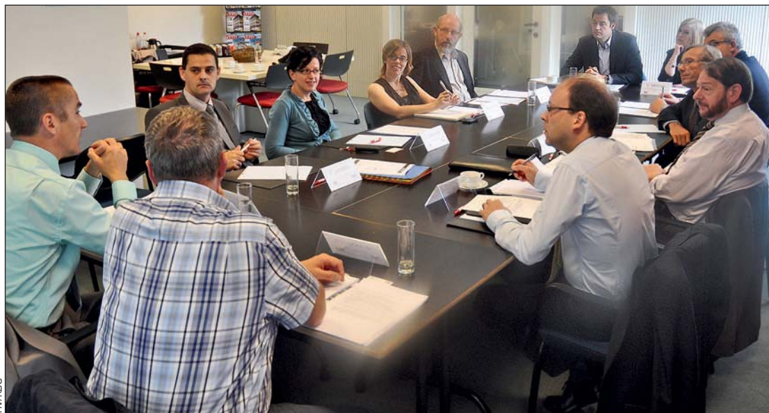
Op de rondetafel 'Onderwijs en industrie' gingen we na wat er op het terrein gebeurt en welke veranderingen wenselijk en haalbaar zouden zijn.

computers, tv's enz. zijn doorgaans compleet achterhaald en al lang vervangen door meer recente modellen eer ze de kans hebben om stuk te gaan. Technologie wordt in dat verhaal gereduceerd tot het downloaden van een app op je nieuwe smartphone. Wat daar aan voorafgaat om zowel de smartphone als de app te ontwikkelen en te realiseren, krijgt nog maar weinig aandacht en spreekt blijkbaar onvoldoende tot de verbeelding. Wat allicht ook meespeelt in de krapte op de arbeidsmarkt is dat jongeren voor hun job hoge verwachtingen koesteren zoals de mogelijkheid om flexibel te werken, gebruik te maken van moderne ICT, enz., zaken die ze niet associëren met technische jobs in de industrie. Als het niet hoeft, zullen ze hun handen niet vuilmaken, wordt wel eens gezegd. De industrie komt doorgaans ook alleen maar in negatieve zin in het nieuws, wanneer er jobs verloren gaan. Kortom, het tekort aan technische profielen op de arbeidsmarkt is een verhaal met veel aspecten waarbij men niet alleen het onderwijs de schuld mag geven. Dat neemt niet weg dat het onderwijs en de manier waarop het georganiseerd wordt een belangrijke bijdrage zou kunnen leveren aan een verbetering van de situatie. De rondetafel leert ook dat er in het onderwijs en in de relatie tussen onderwijs en bedrijfsleven nog heel wat probleempunten zijn die een gepaste oplossing vragen. Een bijkomende nuance die zich wel opdringt, is dat er in het onderwijs al ontzettend veel initiatieven genomen